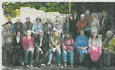
Die Vertreter von 14 „Zeitbank“-Vereinen trafen sich zum Erfahrungsaustausch in Seckach.

In Seckach: Internationales Treffen der „Zeitbank“-Vereine